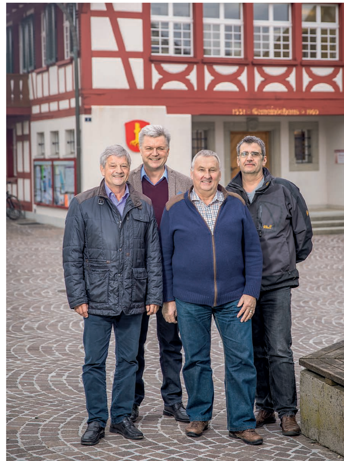
Vier Präsidenten spannen für eine gemeinsame Zukunft zusammen.

Die Begleitung und Beratung von Federas bieten die nötige Struktur und Objektivität in diesem Prozess.»